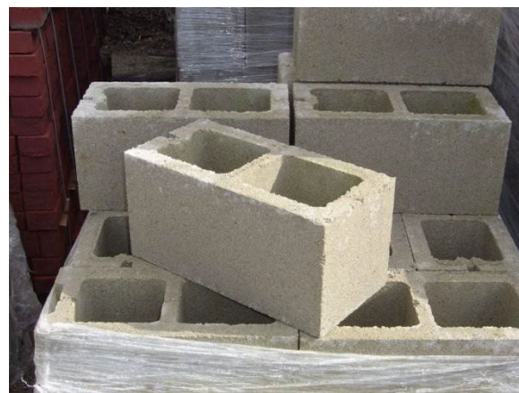
Aunque por lo general consideremos al dióxido de carbono como un producto de desecho, se lo utiliza mucho en la producción de bloques de hormigón.

En su artículo del diario Advanced Science , el equipo destacó que los nanocables de plata hacen más que conducir la electricidad. Actúan como un "catalizador en tándem" que genera dióxido de carbono para alimentar a otros catalizadores, lo que mejora la emisión de dióxido de carbono.