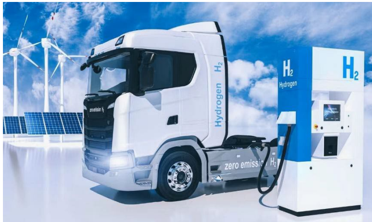
Los vehículos impulsados con hidrógeno que no generan emisión están reemplazando a algunos camiones que usan diésel.

En su informe en la revista Surfaces and Interfaces , el equipo de investigación de University of Lahore y University of Sargodha, ambas universidades de Pakistán, y King Khalid University en Arabia Saudita, entre otras, observaron que, de todos los demás catalizadores que pusieron a prueba, la aleación de plata y níquel era la más estable y permitía el uso a largo plazo: “Este efecto estabilizador promueve el uso a largo plazo del proceso catalítico. Por ende, el sistema de plata y níquel demuestra ser un candidato mucho mejor desde la perspectiva económica en cuanto a la producción de hidrógeno a escala industrial”. Además, agregaron: “Este trabajo resalta la importancia de las condiciones de reacción al obtener un alto rendimiento catalítico y revela la efectiva durabilidad de los catalizadores bimetalicos de plata y níquel, lo que le confiere un gran potencial para la generación práctica y ecológica de hidrógeno”.