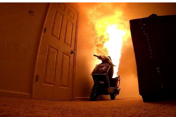
Las baterías con iones de litio con una aleación de óxido de vanadio y plata pueden evitar que las baterías de iones de litio se incendien.

Una alternativa es una batería que usa óxido de vanadio, un compuesto que se emplea por lo general como catalizador para procesos industriales y también como cátodos para baterías. Sin embargo, al igual que como ocurre con las baterías de litio, las baterías de óxido de vanadio también tienen dendritas, crecimientos de cristales que pueden ocasionar fallas. (Consultar La plata podría aumentar la seguridad y la vida útil de las baterías de litio (Silver May Keep Lithium Batteries Safer and Longer Lasting) , febrero de 2026, Silver News ).