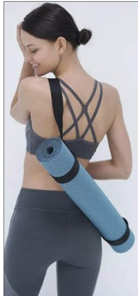
ESTERILLA DE YOGA

Aún no se ha establecido un precio de venta al público, pero estará entre 74-89 US$, dependiendo del tamaño.