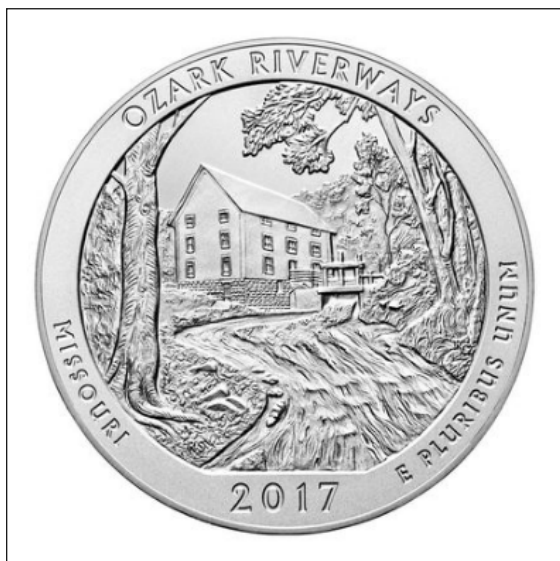
CASA DE LA MONEDA DE EE.UU. (MINT)

La moneda de Ozark es el tercer America the Beautiful Quarter emitido este año. El programa comenzó en 2010, cuando la Casa de la Moneda emitió las primeras monedas con parques nacionales y otros lugares del país. Anualmente se emiten cinco monedas, la última será en 2021. Para obtener una lista de todas las monedas, haga clic aquí.