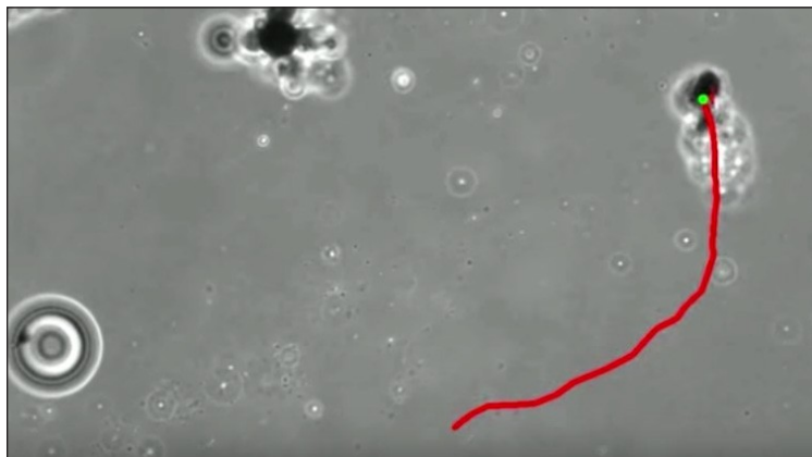
Microbots recubiertos de plata eliminan gérmenes mientras viajan por el agua. Haga clic en la imagen para ver el vídeo.

«... Los microrobots Jano decorados con AgNP [nanopartículas de plata] son una herramienta bactericida eficaz para la desinfección del agua».